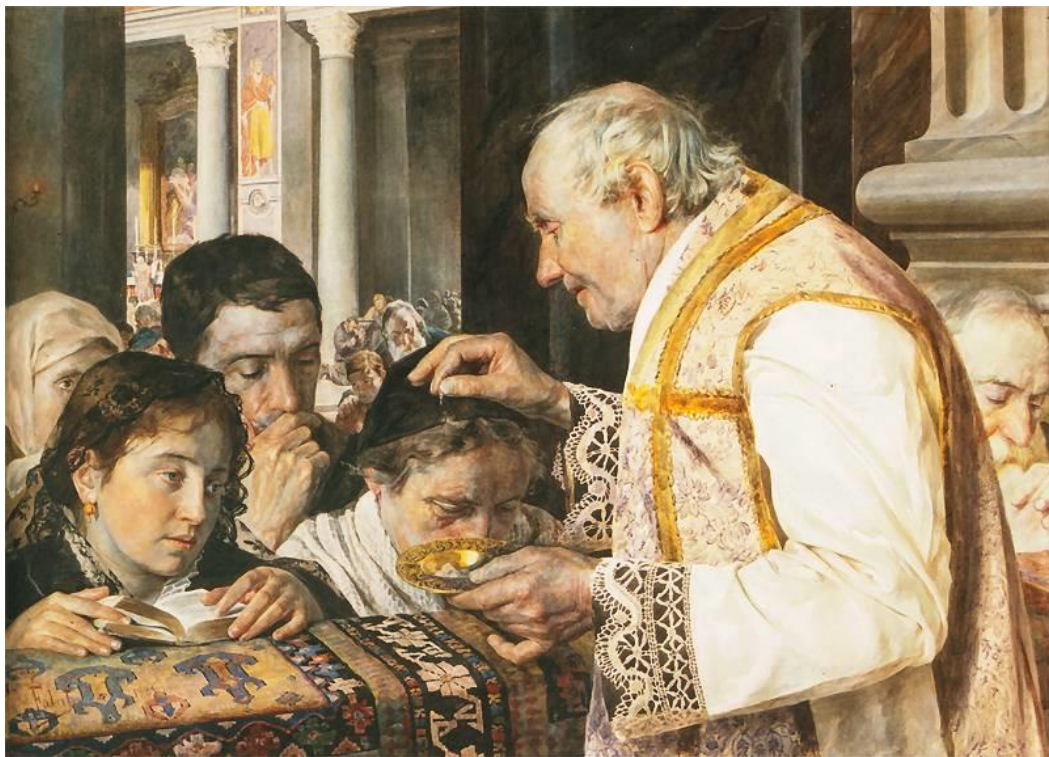
Julian Fałat (1853–1929), Mercredi des Cendres , 1881

D'une part c'était le temps de préparation des catéchumènes, c'est-à-dire des adultes qui allaient recevoir le sacrement du baptême dans la nuit de Pâques. Ce temps était pour eux un temps de formation doctrinale, un temps où l'Église leur enseignait les vérités fondamentales de la foi et où l'évêque, dans ses sermons notamment, leur exposait les principaux mystères chrétiens. Ce temps était également pour eux un temps de mise